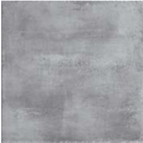
cod. 0028587 Charbon MQ/183 60x60 - 24"x24" BOX/04