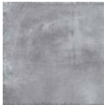
cod. 0027210 Charbon MQ/172 45x45 - 18"x18" BOX/05