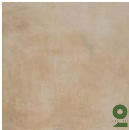
cod. 0028936 2.0 Crete MQ/203 60x60 - 24"x24" BOX/02 cod. 0028767 2.0 Crete Rett. MQ/205 60x60 - 24"x24" BOX/02