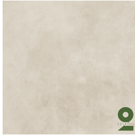
cod. 0028937 2.0 Ivoire MQ/203 60x60 - 24"x24" BOX/02 cod. 0028768 2.0 Ivoire Rett. MQ/205 60x60 - 24"x24" BOX/02