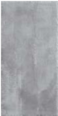
cod. 0027214 Charbon MQ/181 30x60 - 12"x24" BOX/07