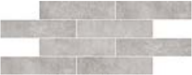
cod. 0028600 Cendre Muretto PZ/111 20x40 - 8"x16" BOX/11