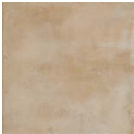
cod. 0028585 Crete MQ/183 60x60 - 24"x24" BOX/04 cod. 0028632 Crete Rett. MQ/187 60x60 - 24"x24" BOX/04