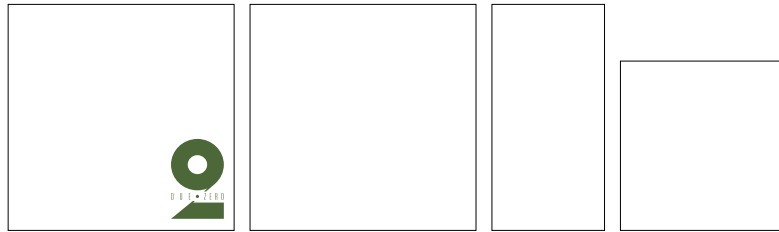
2.0 60x60 Naturale Rettificato