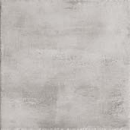
cod. 0028584 Cendre MQ/183 60x60 - 24"x24" BOX/04 cod. 0028631 Cendre Rett. MQ/187 60x60 - 24"x24" BOX/04