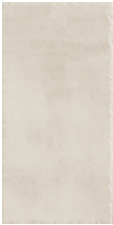
cod. 0027213 Ivoire MQ/181 30x60 - 12"x24" BOX/07