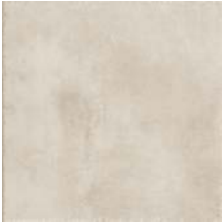
cod. 0028586 Ivoire MQ/183 60x60 - 24"x24" BOX/04 cod. 0028628 Ivoire Rett. MQ/187 60x60 - 24"x24" BOX/04