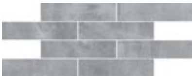
cod. 0028601 Charbon Muretto PZ/111 20x40 - 8"x16" BOX/11