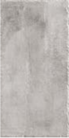
cod. 0027211 Cendre MQ/181 30x60 - 12"x24" BOX/07