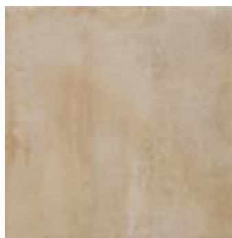
cod. 0027208 Crete MQ/172 45x45 - 18"x18" BOX/05