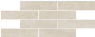
cod. 0028603 Ivoire Muretto PZ/111 20x40 - 8"x16" BOX/11