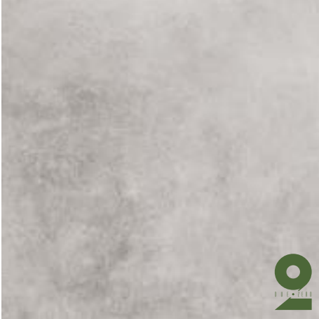
cod. 0028934 2.0 Cendre MQ/203 60x60 - 24"x24" BOX/02 cod. 0028766 2.0 Cendre Rett. MQ/205 60x60 - 24"x24" BOX/02