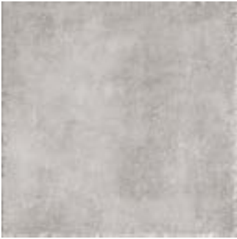
cod. 0027207 Cendre MQ/172 45x45 - 18"x18" BOX/05