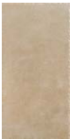
cod. 0027212 Crete MQ/181 30x60 - 12"x24" BOX/07