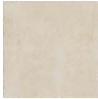
cod. 0027209 Ivoire MQ/172 45x45 - 18"x18" BOX/05