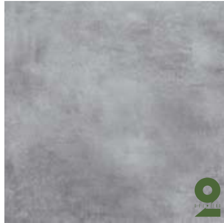
cod. 0028935 2.0 Charbon MQ/203 60x60 - 24"x24" BOX/02