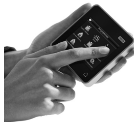
Commande tactile KLR 200

8 programmes de confort déjà enregistrés. Fermeture automatique de la fenêtre en cas d'averse grâce au détecteur de pluie.