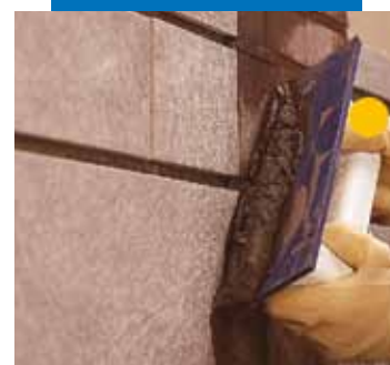
Autre exemple d'application d' Ultracolor Plus à la spatule en caoutchouc en mur