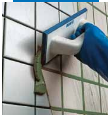
Jointoiment en mur avec la spatule caoutchouc