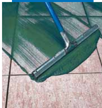
Application d'Ultracolor Plus en sol à la raclette

Utiliser la gâchée dans les 20 à 25 minutes qui suivent sa préparation (à + 20°C).