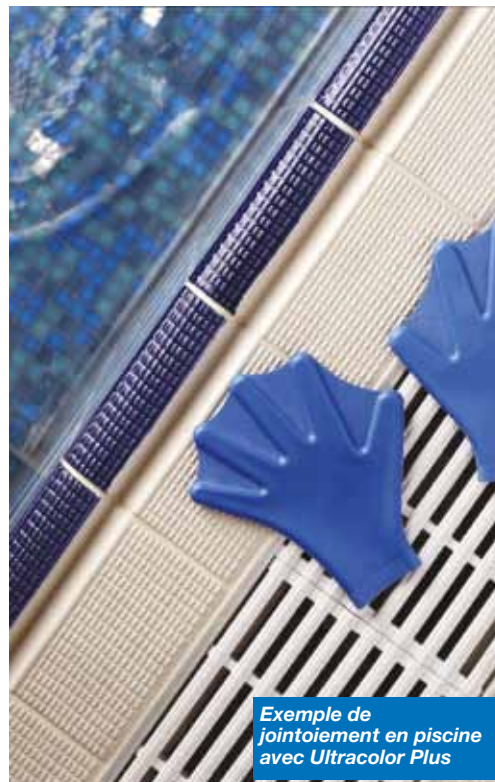
Exemple de jointoiment en piscine avec Ultracolor Plus