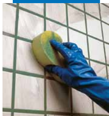
Nettoyage et finition des joints à l'éponge, en mur