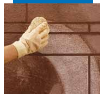
Nettoyage et finition des joints à l'éponge