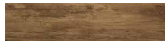
CWD32R5 CHERRY 30x120