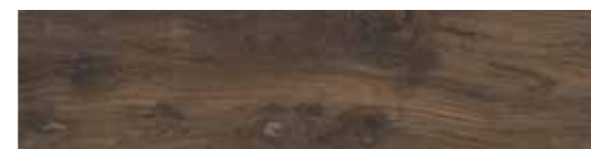
CWD32R8 WALNUTS 30x120