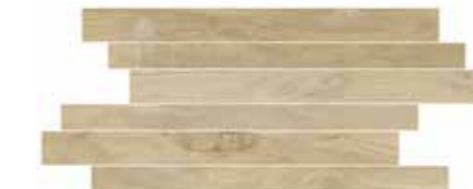
CWD2SK STICK ELM 20X50