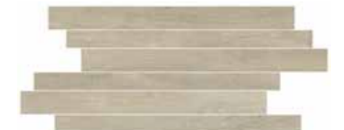
CWD4SK STICK MAPLE 20X50