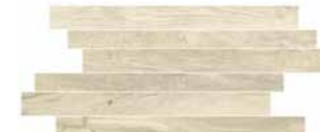
CWD1SK STICK ALMONDS 20X50

decorations and special trims / décors et pièces spéciales / Dekore und Formteile