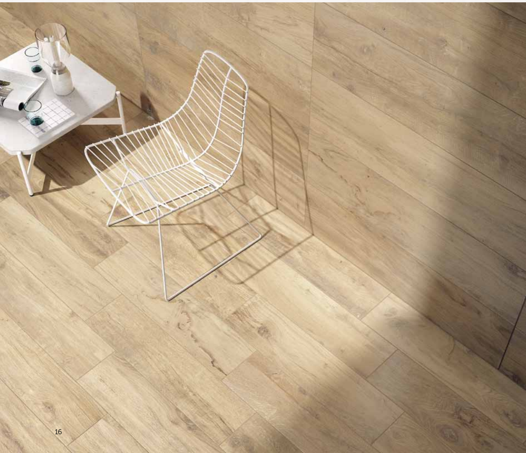
wooldand elm floor 20x80 wall 30x120