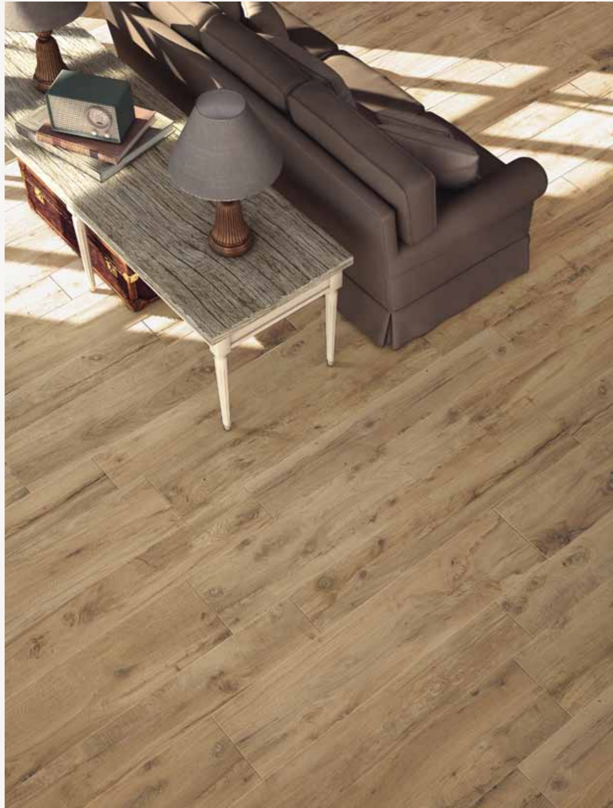
wooldand oak 20x120 30x120