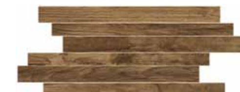
CWD5SK STICK CHERRY 20X50