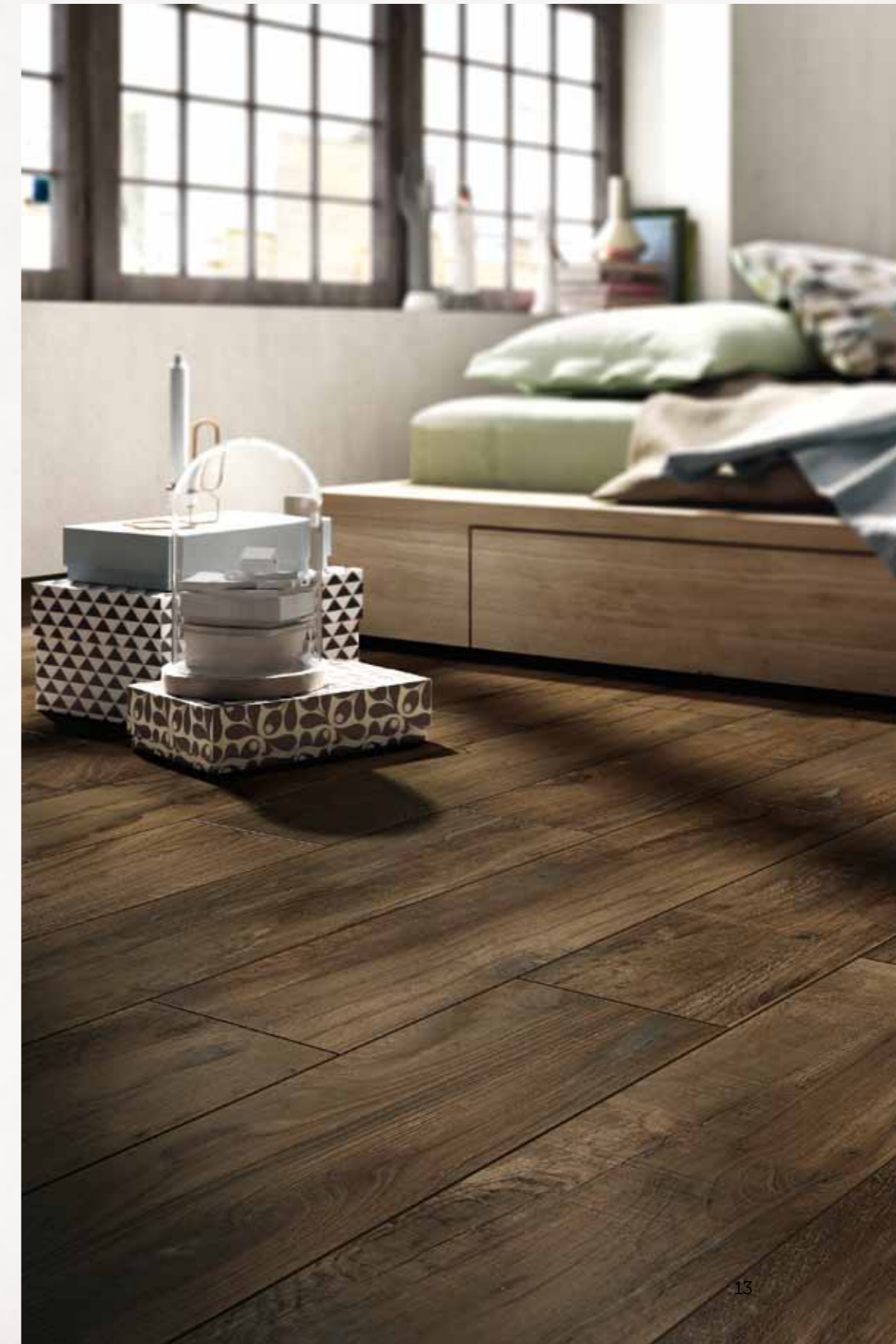
wooldand walnuts 20x80