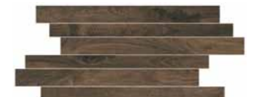
CWD8SK STICK WALNUTS 20X50