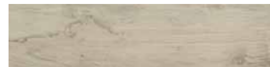
CWD32R4 MAPLE 30x120