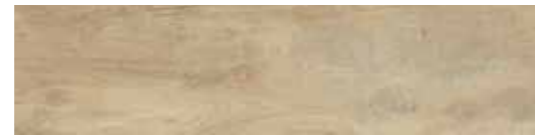
CWD32R2 ELM 30x120