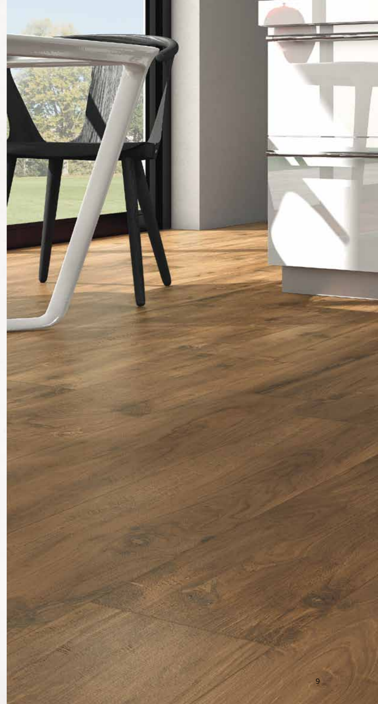
wooldand cherry 30x120