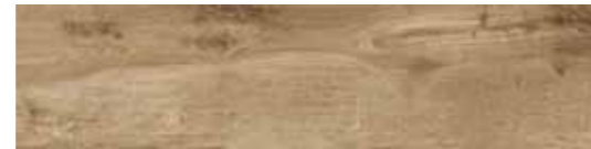
CWD32R6 OAK 30x120