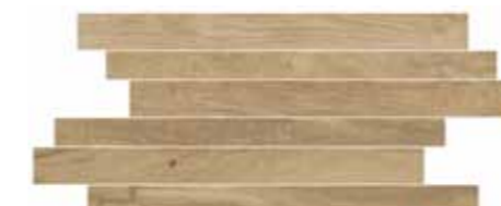
CWD6SK STICK OAK 20X50