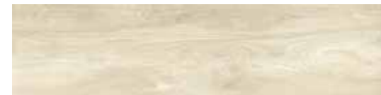
CWD32R1 ALMONDS 30x120