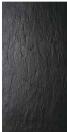
cm 30x60 12"x24" 7266201 ARDESIA NERO ● 76 7266203 ARDESIA NERO naturale rettificato ● 84