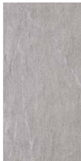
cm 30x60 12"x24" 7266211 ARDESIA GRIGIO ● 76 7263481 ARDESIA GRIGIO naturale rettificato ● 84