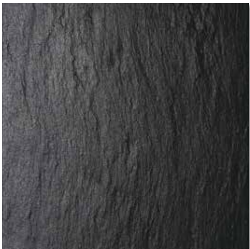
cm 60x60 24"x24" 7322731 ARDESIA NERO ● 83 7322745 ARDESIA NERO naturale rettificato ● 89