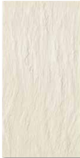
cm 30x60 12"x24" 7262931 ARDESIA BIANCO ● 76 7263511 ARDESIA BIANCO naturale rettificato ● 84