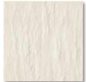
cm 30x30 12"x12" 7263561 ARDESIA BIANCO naturale rettificato ● 84