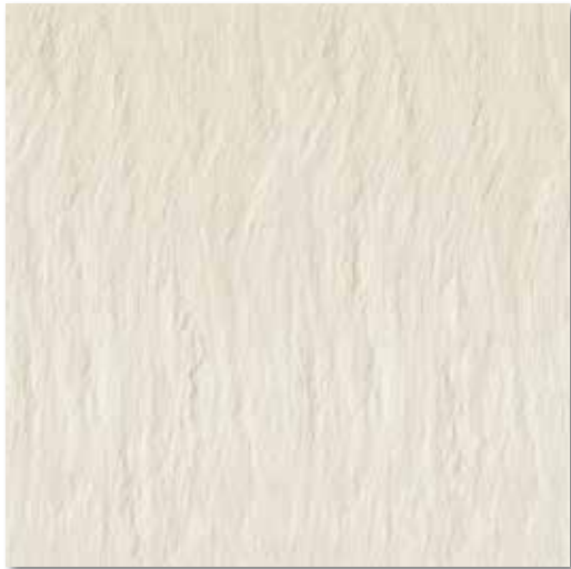
cm 60x60 24"x24" 7327549 ARDESIA BIANCO ● 83 7327559 ARDESIA BIANCO naturale rettificato ● 89