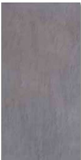
cm 30x60 12"x24" 7266241 ARDESIA ANTRACITE ● 76 7263501 ARDESIA ANTRACITE naturale rettificato ● 84