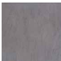
cm 30x30 12"x12" 7263551 ARDESIA ANTRACITE naturale rettificato ● 84