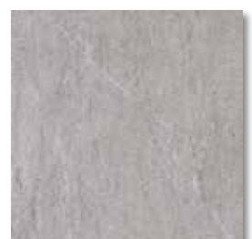
cm 30x30 12"x12" 7263531 ARDESIA GRIGIO naturale rettificato ● 84