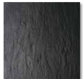
cm 30x30 12"x12" 7263521 ARDESIA NERO naturale rettificato ● 84