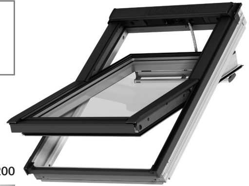
Commande tactile KLR 200