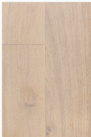
P112 Chêne Mirage * Original