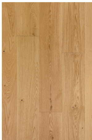
P131 Chêne natur * Original