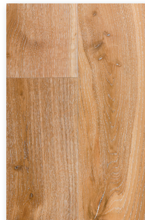
P125 Chêne Cérusé blanc * Authentic Nuancé