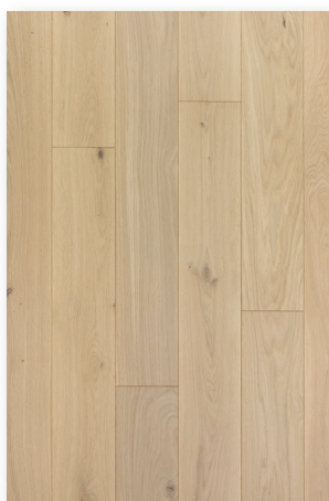
PO78 Chêne Pure ** Original