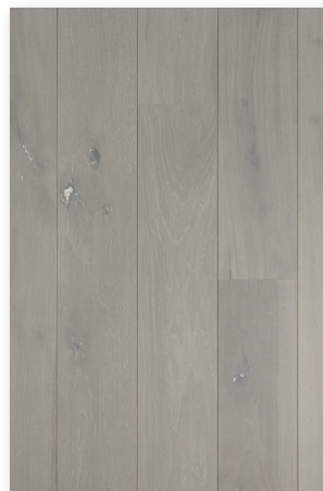
P124 Chêne Zinc * Authentic Nuancé