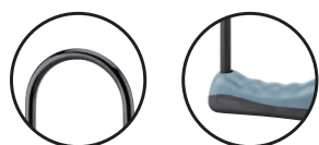
Acier gainé PVC