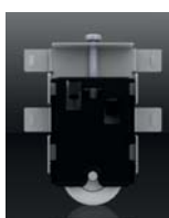
Guide bas sur roulement à billes