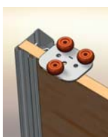
Guide haut à 3 roulettes