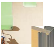
PRÊT À PEINDRE OU À TAPISSER