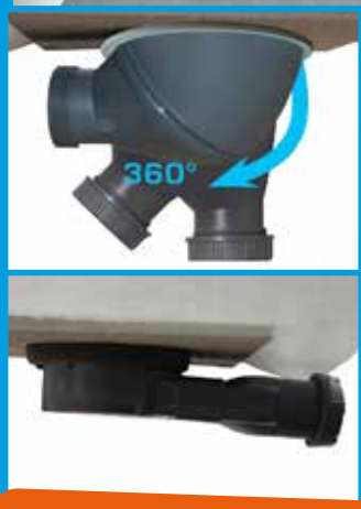
► RC20 ACIER siphon 360°