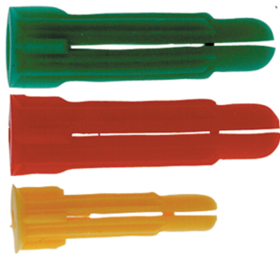
Fixation multi-usages PC