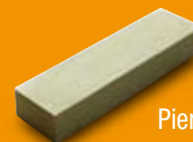
Pierre à aviver. Ref. 416