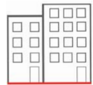
Logements collectifs et ERP