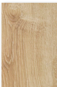
621 CHÊNE CANARIES **