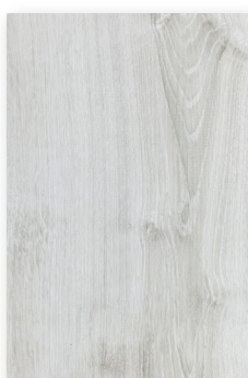
627 CHÊNE POLAIRE **