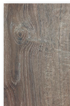
625 CORFOU **