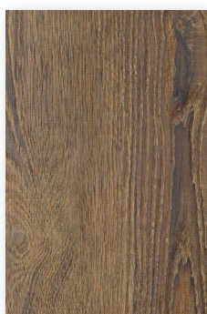
620 CHÊNE CORSE **