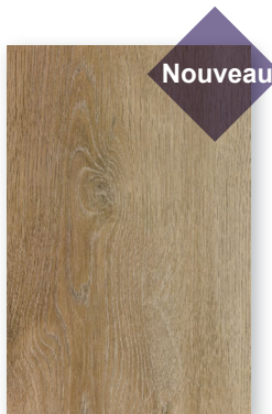
529 CHÊNE AMANDE *