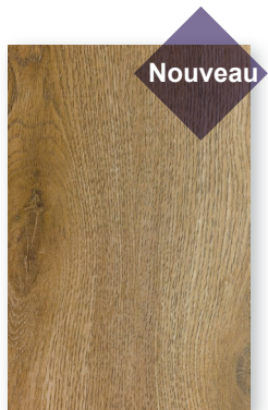
535 CHÊNE PRALIN *