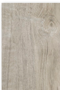
619 CHÊNE SARDAIGNE **