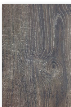
626 JERSEY **