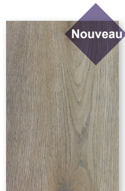
536 CHÊNE LIN *