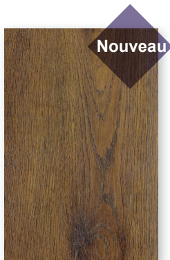
528 CHÊNE NOISETTE *