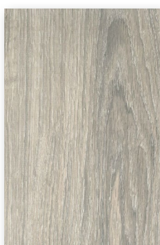
628 CHÊNE MAJORQUE **

* Synchrones ** Synchrones et héliochromes