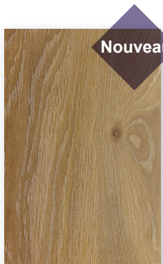
518 RAFIA *