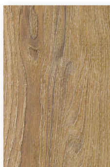
622 CHÊNE BALÉARES **