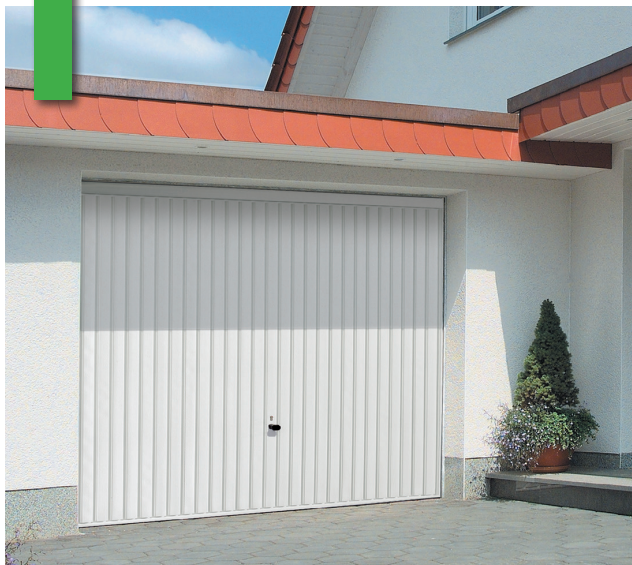
Porte basculante EuroPro motif 122, RAL 9016